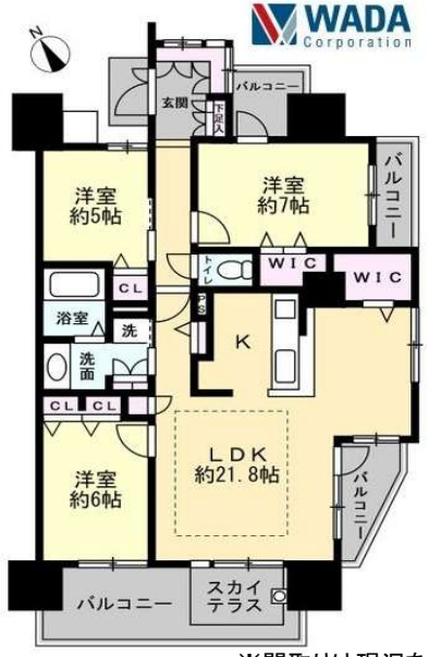
※間取りは現況を優先します。